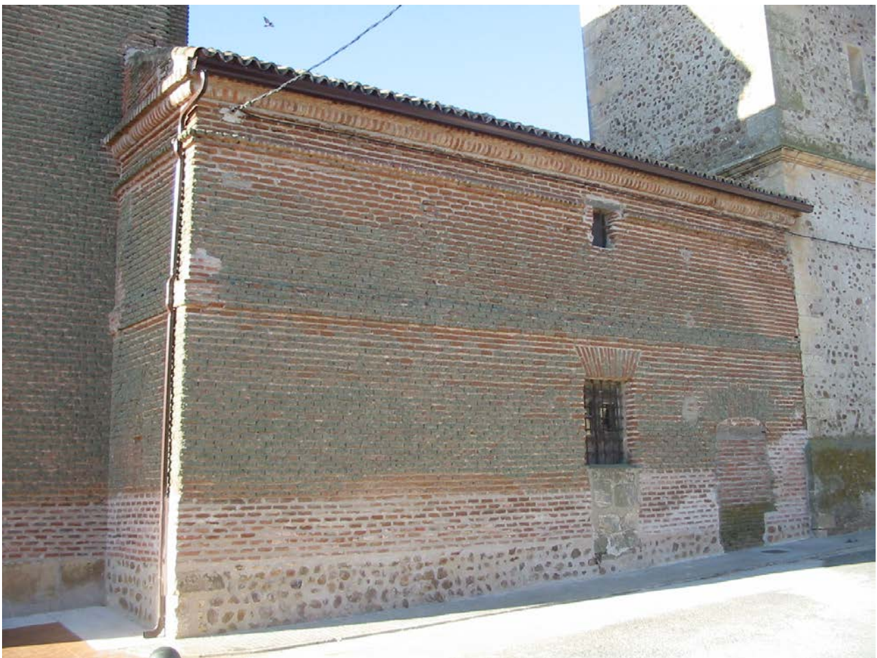
La sacristía abajo, y la cámara de los diezmos del pontifical arriba

adosan la única nave de la nueva, a la cara sur de la torre, quedando al aire los lados este, norte, y oeste. En épocas posteriores se adosa a la iglesia por la parte norte entre el crucero y la torre, la sacristía con una entrada desde la calle junto a la torre. Más adelante en 1772 se levanta otro piso encima de ella para una cámara ó granero donde se guardarán los diezmos del pontifical; para ello se acorta la sacristía con un tabique condenando la puerta exterior, que se aprovecha para con una escalera acceder al granero del piso superior, y por la parte sur o mediodía desde los pies de la iglesia al crucero, primero el pórtico o atrio, a continuación otro granero que también se construye en 1772, al que se accede desde el pórtico, después en 1785 se desmonta el pórtico por su mal estado y se construye uno nuevo, en el año 1786.